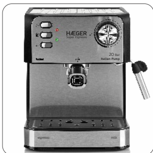
Detachable frothing nozzle and drip tray Bocal de espuma e bandeja de gotejamento destacável Boquilla de espuma y bandeja de goteo desmontable Buse de moussage amovible et bac de récupération

Potência: 850 Watts - 220-240~ 50/60Hz Potencia: 850 Watts - 220-240V~ 50/60Hz Puissance: 850 Watts - 220-240V~ 50/60Hz