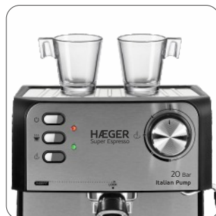
Hotplate for coffee cup preheating Placa de pré-aquecimento em Inox para chávenas Placa de precalentamiento en Inox para las tazas Plate de préchauffage de tasses en Inox