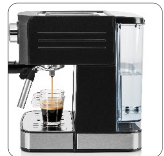
Large 1.6L detachable water tank Tanque de água de grandes dimensões com 1.6L Tanque de agua grande desmontable con 1.6L Grand réservoir d'eau amovible avec 1.6L